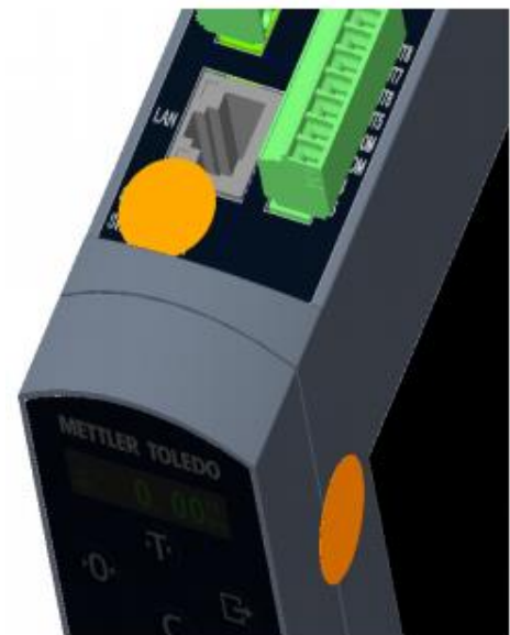
Typical DIN Rail Model Sealing / Scellage typique d'un modèle de rail DIN