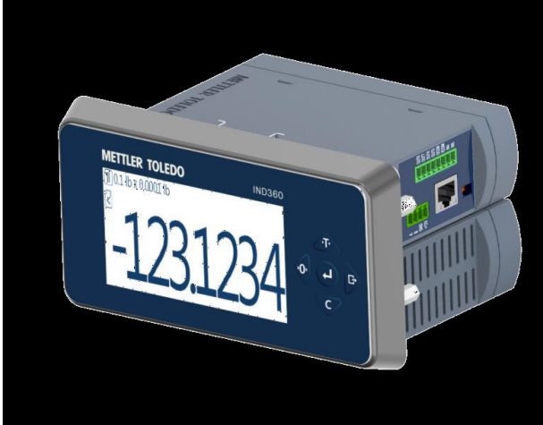
Typical Panel Mount Model / Modèle typique de montage sur panneau