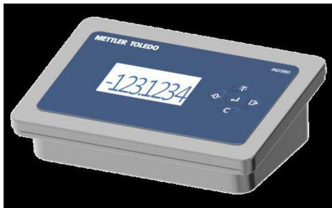
Typical Harsh Model / La modèle Harsh