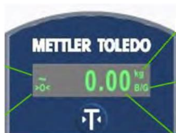
Typical DIN Rail Display / Affichage typique sur rail DIN