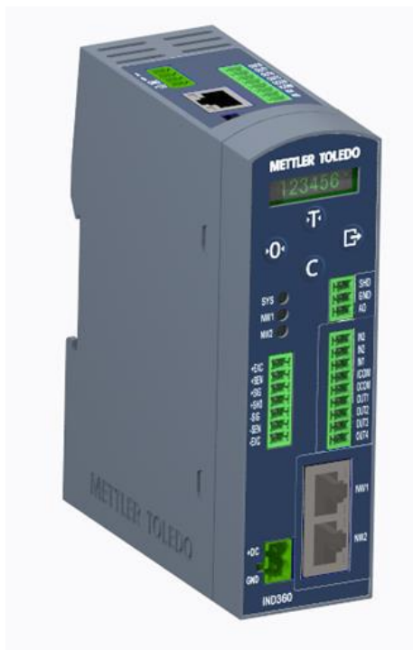
Typical DIN Rail Model / Modèle type de rail DIN