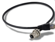
Kit di estensione, Ethernet [30139562]