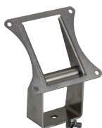
Staffa posizionabile [22020286]