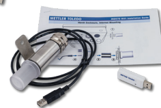
WiFi kit, Montato in remoto [30499149]