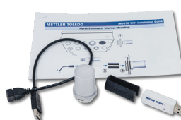
WiFi kit, Montato su terminale [30499148]