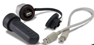
Kit di estensione, USB [30139559]