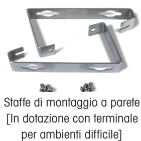
Staffe di montaggio a parete [In dotazione con terminale per ambienti difficile]